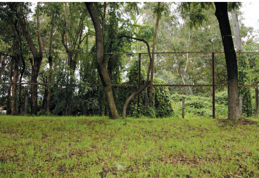
Imagen 16. Sobre la calle Paseo de Sicilia se aprecia un talud verde que delimita la visibilidad del Canal Nacional abierto, el cual divide a la colonia Lomas Estrella 2ª. Sección de la Zona de Reserva Ecológica, donde hay plantas potabilizadoras y de bombeo. Como puede observarse el límite está enrejado, evitando el contacto de los habitantes de esta colonia con la naturaleza próxima.