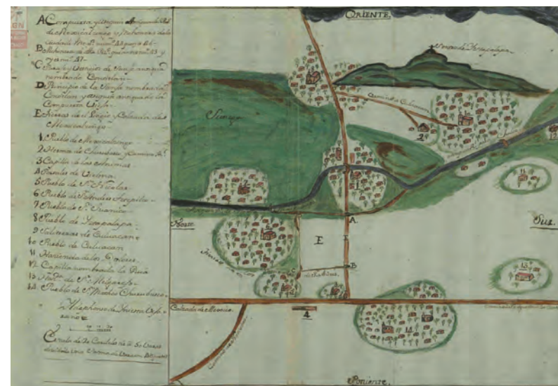
Imagen 3. Plano de la Zona de Iztapalapa donde se indican los principales pueblos, haciendas, capillas, portales, caminos, compuertas y mojoneras. Destaca el pueblo de Iztapalapa, Culhuacán y Mexicalzingo. La zona donde se asienta Lomas Estrella 2ª. Sección aparece en éste plano antiguo junto al Canal de Chalco, entre Ciénegas y zonas de cultivo.