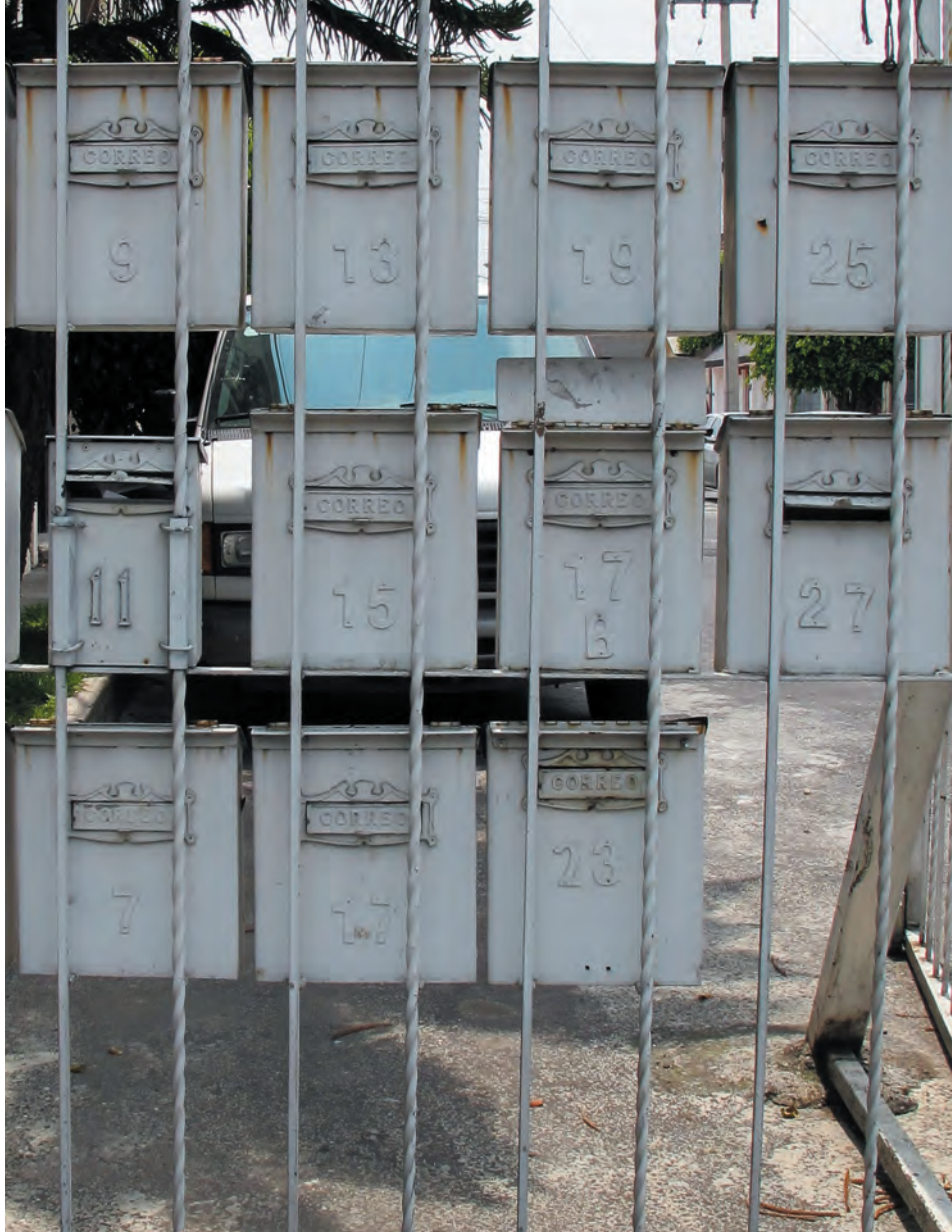
Imagen 19. Las bondades de la traza urbana de Lomas Estrella 2ª sección se demerita con el cierre de la mayoría de las calles. La construcción de rejas y casetas de vigilancia generan una agresión al entorno y no proporciona una solución a la inseguridad. En cambio, limita la convivencia vecinal y el disfrute de la colonia como una sola unidad espacial.