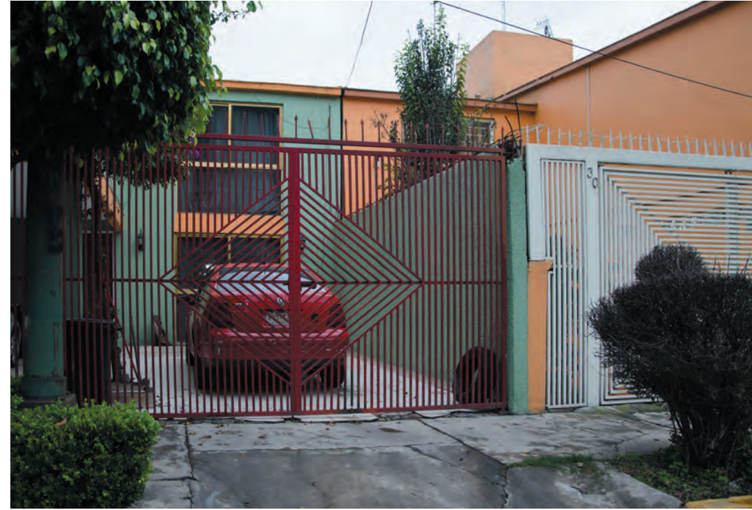
Imagen 24 y 25. Hay una constante en la arquitectura edificada en la colonia Lomas Estrella 2ª sección, en donde casas y edificios se espejean, creando edificaciones siamesas, es decir, es el mismo diseño en donde sólo cambia el color o el tipo de reja.