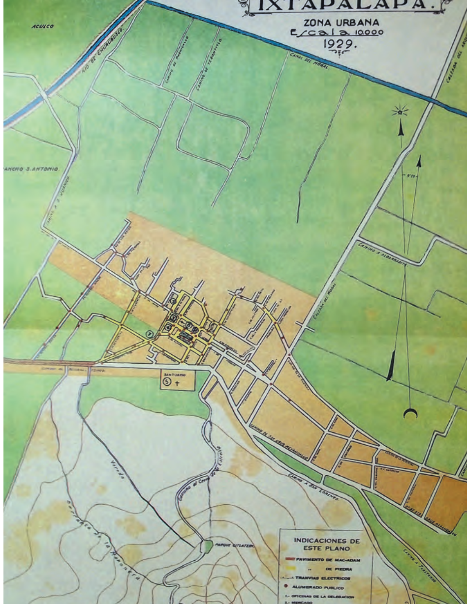
Imagen 4. Plano de la municipalidad de Ixtapalapa, realizado en 1929, donde se aprecia el Cerro de la Estrella con lo que era, tan sólo un pequeño asentamiento urbano en su costado norte.

demanda de infraestructura y equipamiento que, cada vez más exige la población.” 9