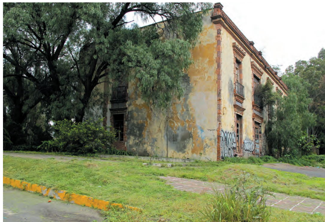
Imagen 9. Parte del casco de la hacienda de San Lorenzo Tezonco en estado ruinoso, la cual se encuentra al interior del Panteón del mismo nombre. Una magnífica edificación que nos recuerdan la poderosa historia de nuestra ciudad y los cambios tan dramáticos en la construcción de la ciudad de México durante el siglo XX.