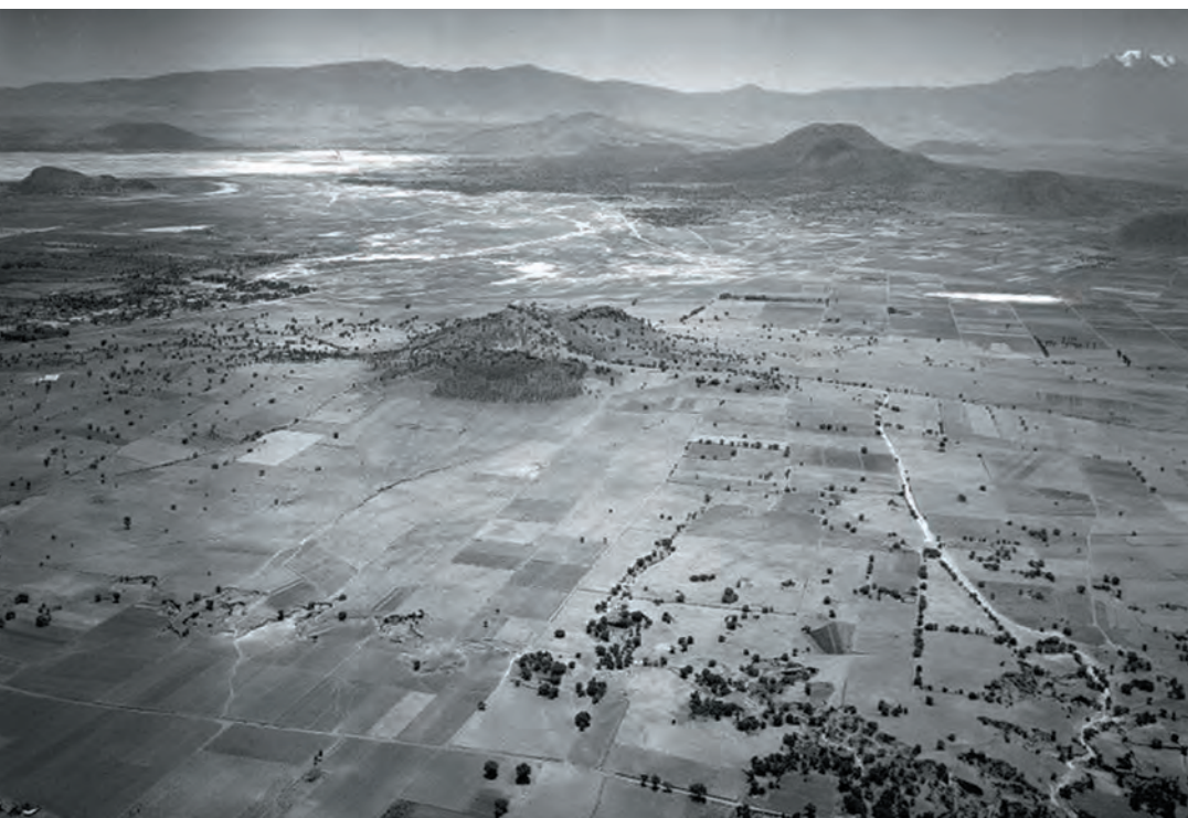
Imagen 5. Vista aérea de los años treinta del siglo XX, donde se aprecia el Cerro de la Estrella completamente libre de edificaciones a su alrededor. Al fondo la Sierra de Santa Catarina y detrás el Iztaccíhuatl. Actualmente es la delegación con mayor número de habitantes y está completamente urbanizado. La colonia Lomas Estrella 2ª sección se establece en su costado sur en los años 60 del siglo XX, sobre lo que eran Ciénegas y áreas de cultivo en la parte derecha de la imagen.