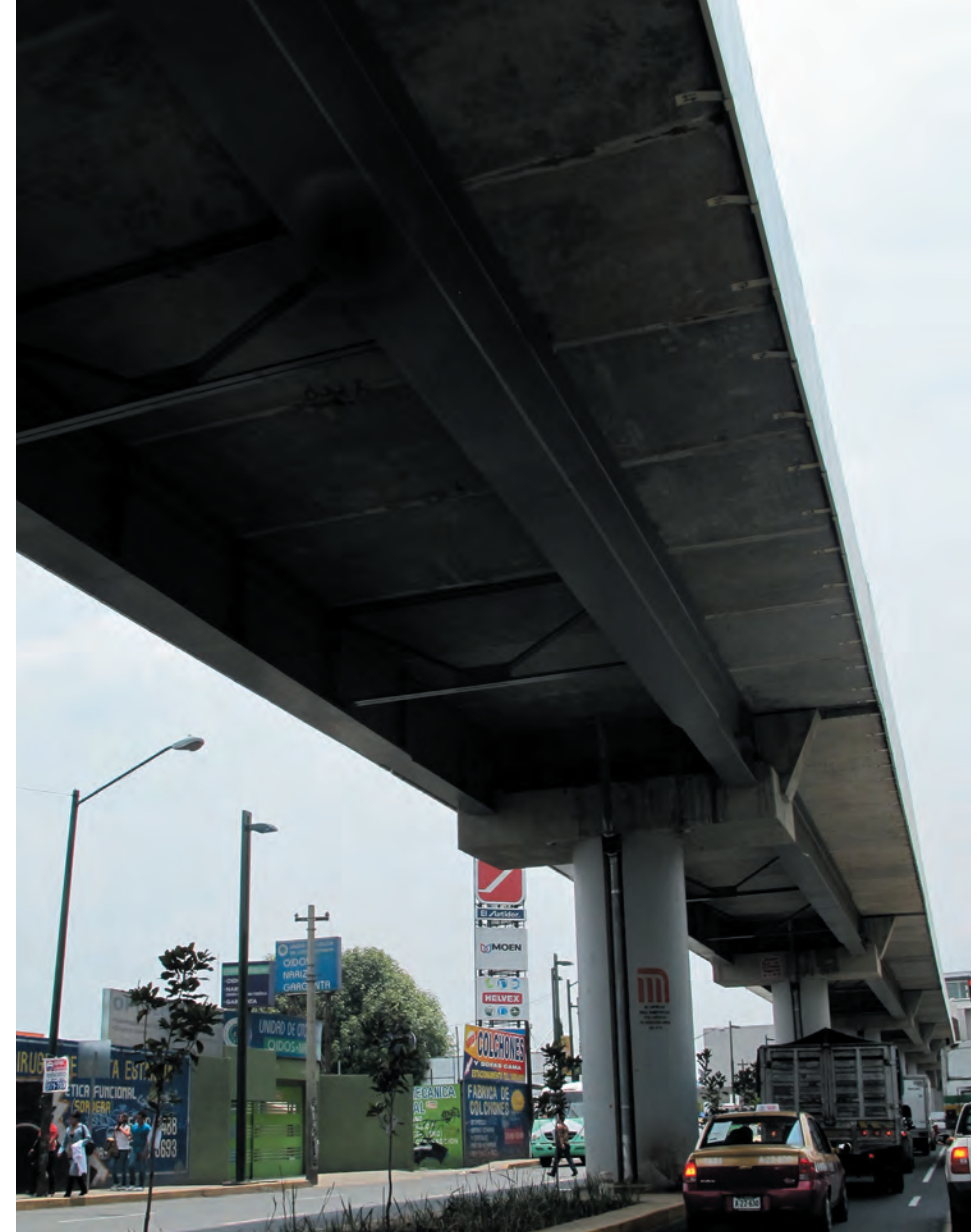
Imagen 27. Las vialidades como la Calzada de Tláhuac, aunada a el elevado del Metro de la Línea 12 ó Dorada se vuelven límites infranqueables entre colonias vecinas que habían sido una sola unidad territorial.

Dos aspectos principales deberían de revertirse en la zona: uno, su contacto directo con la Zona de Reserva Ecológica y el Canal de