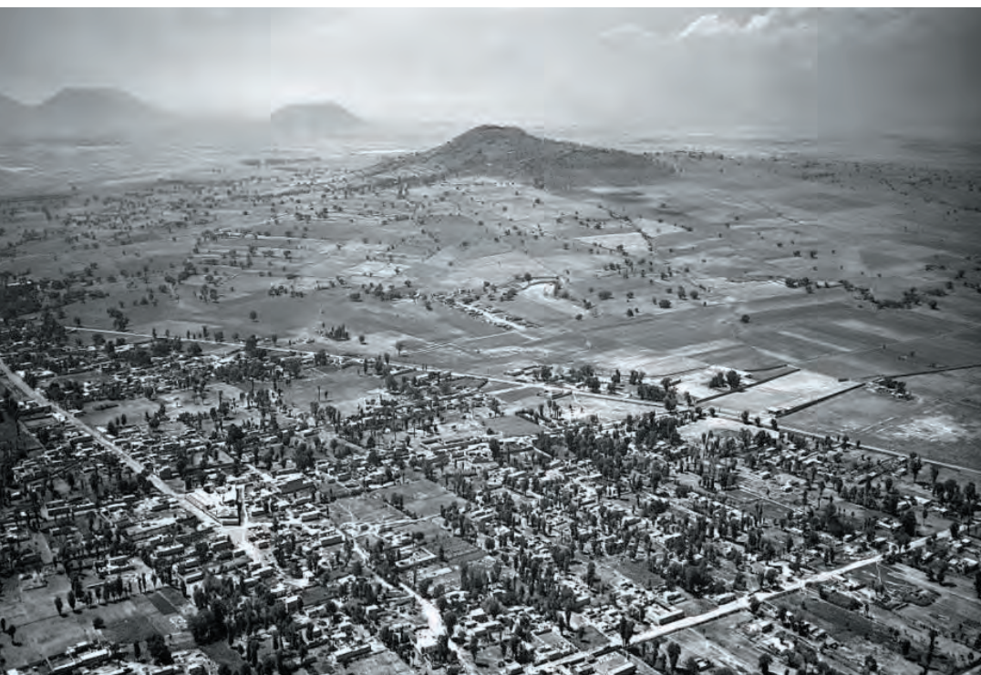
Imagen 11. Vista de la población de Iztapalapa y su convento. Al fondo el Cerro de La Estrella completamente aislado y sin edificaciones alrededor.

cima del cerro. 19 Sin embargo, a pesar de la declaratoria como Parque Nacional, de su importancia como recinto ceremonial prehispánico y por la celebración de la Semana Santa, la “Asamblea Legislativa del DF (ALDF) ya analiza legalizar los asentamientos humanos irregulares que se ubican en él.” 20