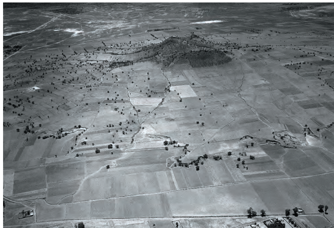
Imagen 6. Vista aérea de los años treinta del siglo XX, donde se aprecia el Cerro de la Estrella completamente libre de edificaciones a su alrededor. Conforme a esta vista, la colonia Lomas Estrella y 2ª sección se establecen en la parte derecha del Cerro de la Estrella en los años 60 del siglo XX.