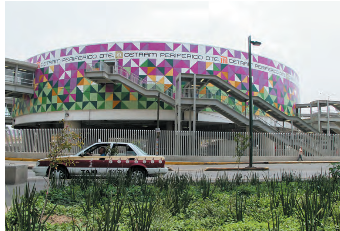
Imagen 21. Parada de la Línea 12 sobre Avenida Tláhuac, del Sistema Colectivo Metro. Límite físico que dividió las colonias Lomas Estrella 1ª y 2ª sección.