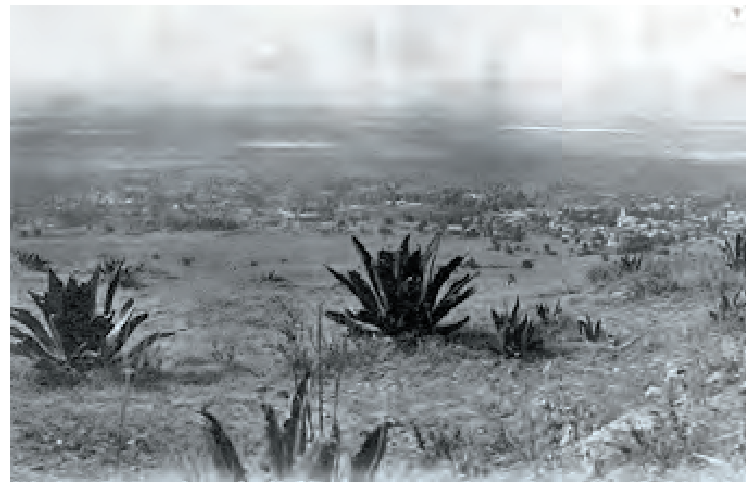
Imagen 10. Vista desde el cerro de La Estrella.

Actualmente el Cerro de la Estrella alberga una zona de conservación ecológica, dónde también se encuentran vestigios arqueológicos como lo son Pirámide llamada “Templo del Fuego Nuevo”, en la