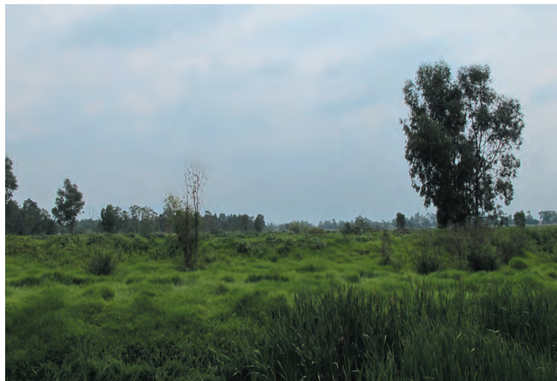
Imagen 17. Vista hacia la zona de reserva ecológica ubicada en el límite entre Xochimilco e Iztapalapa. Una extensa área que requiere un programa de recate para integrarla a la vida cotidiana de las colonias circundantes.