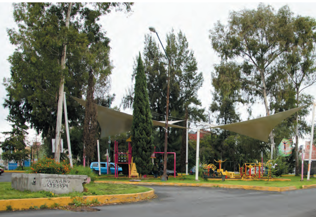
Imagen 18. La colonia estrella tiene una traza muy particular, con mucho movimiento, provocado por el trazo de algunas avenidas principales que cuentan con un camellón al centro y que van generando algunos resquicios, donde se han diseñado espacios de convivencia y áreas de juego infantil.

y Lusitania (Italiana), Frigia (Turquía).