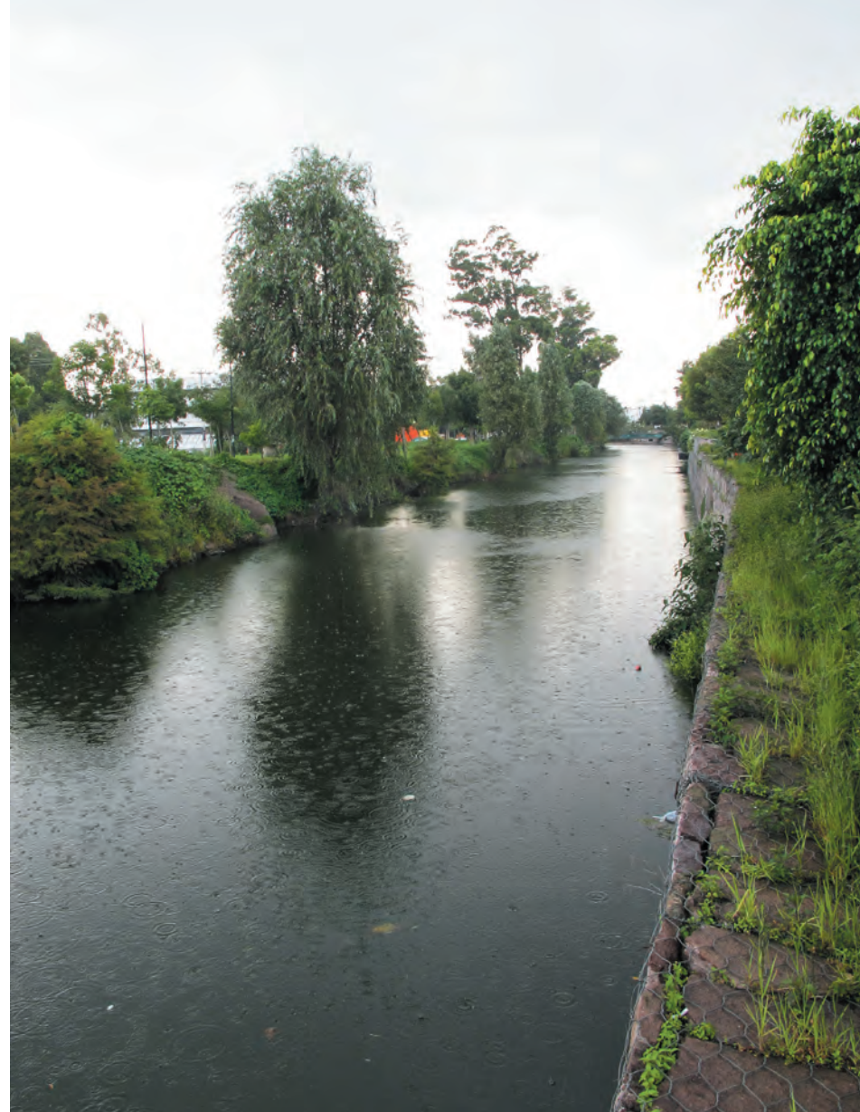
Imagen 15. Vista del Canal Nacional a cielo abierto, el cual lleva agua de Xochimilco hacia el que era el Canal de La Viga y que en 1940 paso a ser un canal de aguas negras. Algunas colonias como Santa María y San Andrés Tomatlán, Zona Urbana Ejidal Estrella Culhuacán, Tula y Valle del Sur gozan de este canal, teniendo lugares de esparcimiento a su costado. Hasta llegar al encuentro con el Río Churubusco y la Calzada de la Viga, donde se pierde bajo el asfalto.