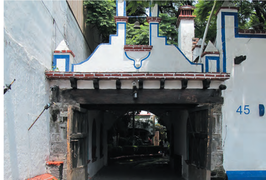
Imagen 22 y 23. La hacienda de San Nicolás Tolentino parece una réplica a pequeña escala de las antiguas haciendas del Valle de México. Actualmente se utiliza para eventos sociales.