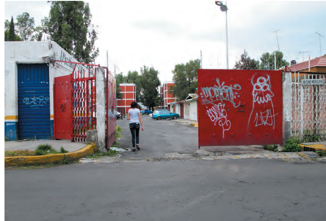
Imagen 20. Conjuntos habitacionales al interior y exterior de la colonia Lomas Estrella que van generando ghettos aislados con rejas y portones que van cercenando el espacio común.