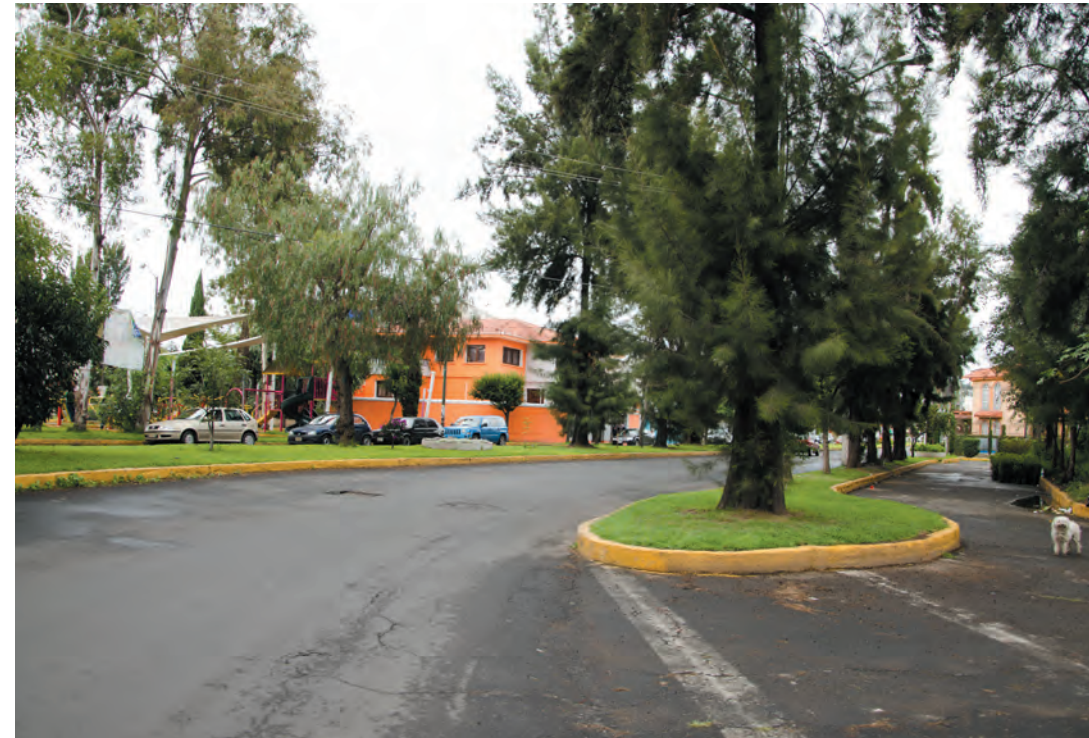
Imagen 13. Paseo Las Galias es una de las avenidas principales de la colonia Lomas Estrella 2ª. Sección. Por su forma curva, logra adaptarse de manera natural a la traza reticular que va en el sentido Norte-Sur con la del sentido Oriente-Poniente. Los camellones están perfectamente arbolados y cuidados.

En cambio, las calles dirección Oriente-Poniente tienen nombres de ciudades de origen griego o romano como es el caso de Cártago (al Norte de África), Epiro, Efeso y Macedonia (Grecia), Balbek (Líbano), Ruan y Orleans (Francia), Tréveris (Alemania), Lutecia