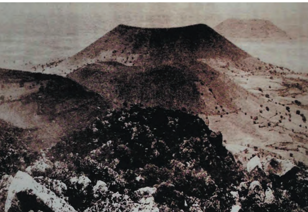
Imagen 2. La topografía de Iztapalapa es completamente plana con excepción de la línea volcánica que se levanta en el Sur y Oriente de la demarcación. Montañas prodigiosas que se alzan entre Iztapalapa y Tláhuac. El Cerro de la Estrella es la montaña que culmina de manera aislada ésta cadena de sierras, montañas, y volcanes. En ésta imagen tomada en 1930, se aprecia todo el espacio libre, sin urbanizar.