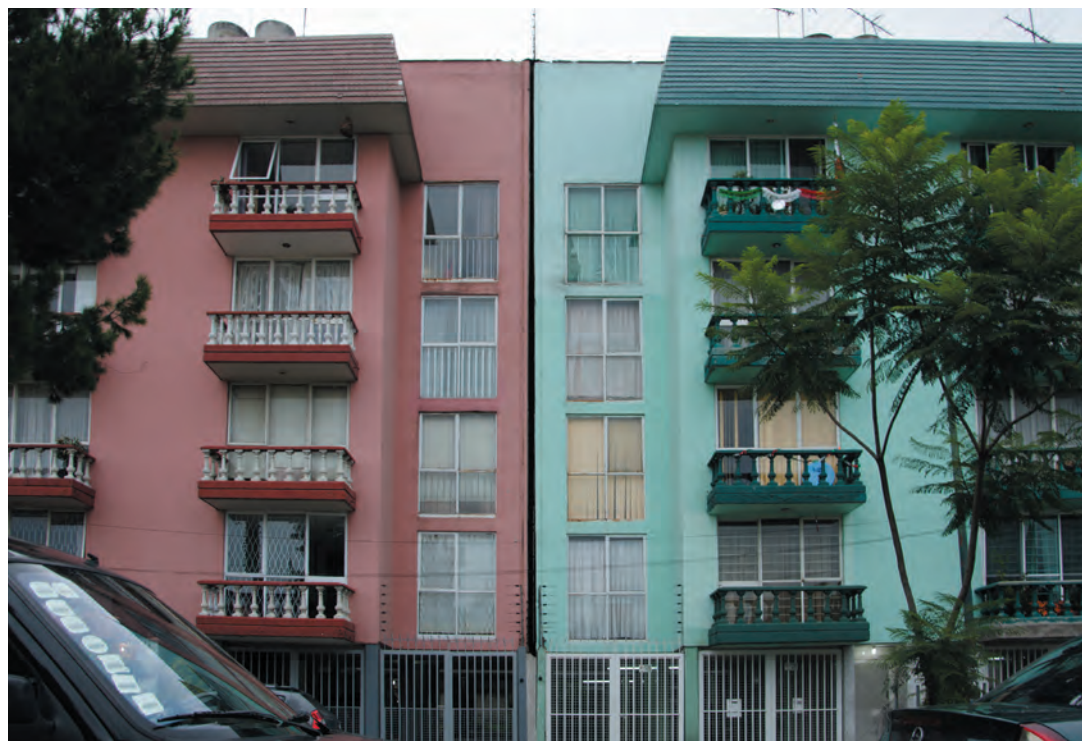
Imagen 26. Lo mismo sucede con edificaciones de vivienda de más de dos niveles, en donde se edifican dos construcciones idénticas.