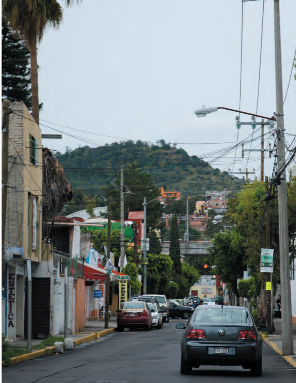
Imagen 12. Técnicos y Manuales es la avenida limitrofe de Lomas Estrella y 2ª. Sección es una calle que remata con la cresta del Cerro de la Estrella en un poderoso eje visual.

Lomas Estrella inicia su fraccionamiento en 1955, cuando apenas se contaban 5 casas en una calle; pero, no tardaría en poblarse y extenderse hasta ocupar todo el terreno del antiguo Rancho de La Estrella. Para 1960 ya estaban establecidas las 3 secciones: Lomas Estrella, 1ª y 2ª sección. Y es hasta 1965 cuando llegaron las líneas telefónicas a éste lugar residencial. Los autobuses sólo pasaban cada hora con rumbo a Tulyehualco.