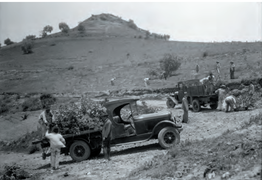
Imagen 8. Todavía en 1940 la mayor parte del territorio de Iztapalapa era campo y la gente se dedicaba a cultivarlo. En la imagen se aprecia el Cerro de la Estrella completamente árido y los trabajadores están limpiando el terreno y reforestando.