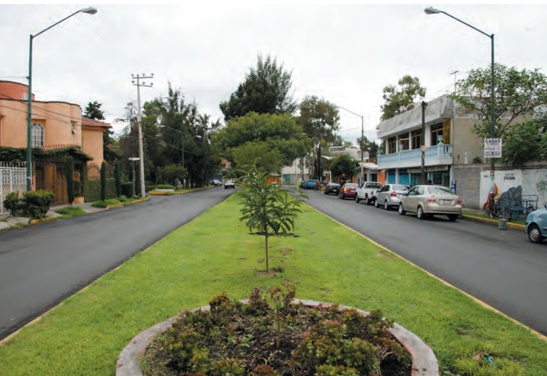
Imagen 14. Vista del camellón en Paseo las Galias.