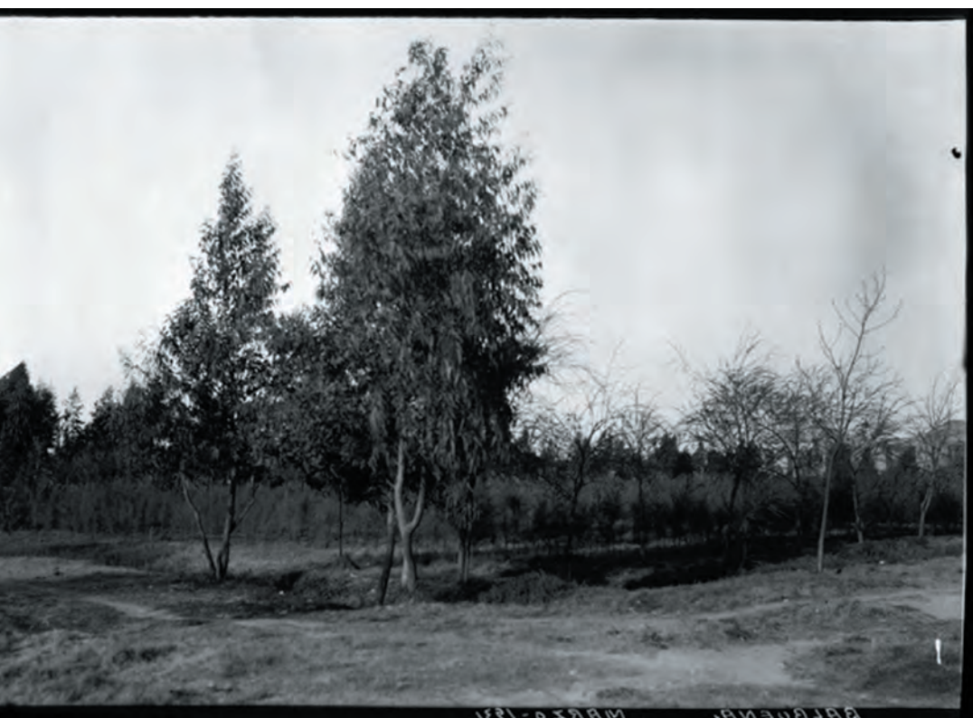
Imagen 8. Porfirio Díaz, propició la creación del Parque Jardín Balbuena para reverdecer los famosos llanos, una vista de la reforestación en Balbuena tomada en marzo de 1931.

“Es difícil imaginar hoy en día cómo era el paisaje urbano de la ciudad de México con tantos cambios y modificaciones que ha sufrido. Pero hasta finales del siglo XVIII era una ciudad llena de acequias que recorrían sus calles como las venas de un cuerpo vigoroso.” 20 Por aquel entonces, la ciudad tenía al menos 20 puentes de madera y piedra que permitían cruzar de un lugar a otro. Cada puente además tenía su propio embarcadero. Es por esto, que encontramos en muchas crónicas de la época descripciones de la ciudad que la hacen comparable a Venecia.