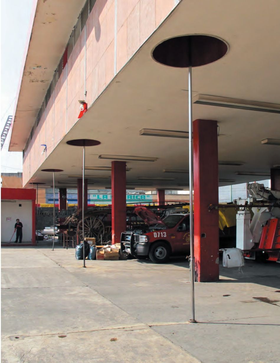
Imagen 31. Vista de uno de los primeros edificios de bomberos en estilo funcionalista ubicado sobre Calzada de la Viga.