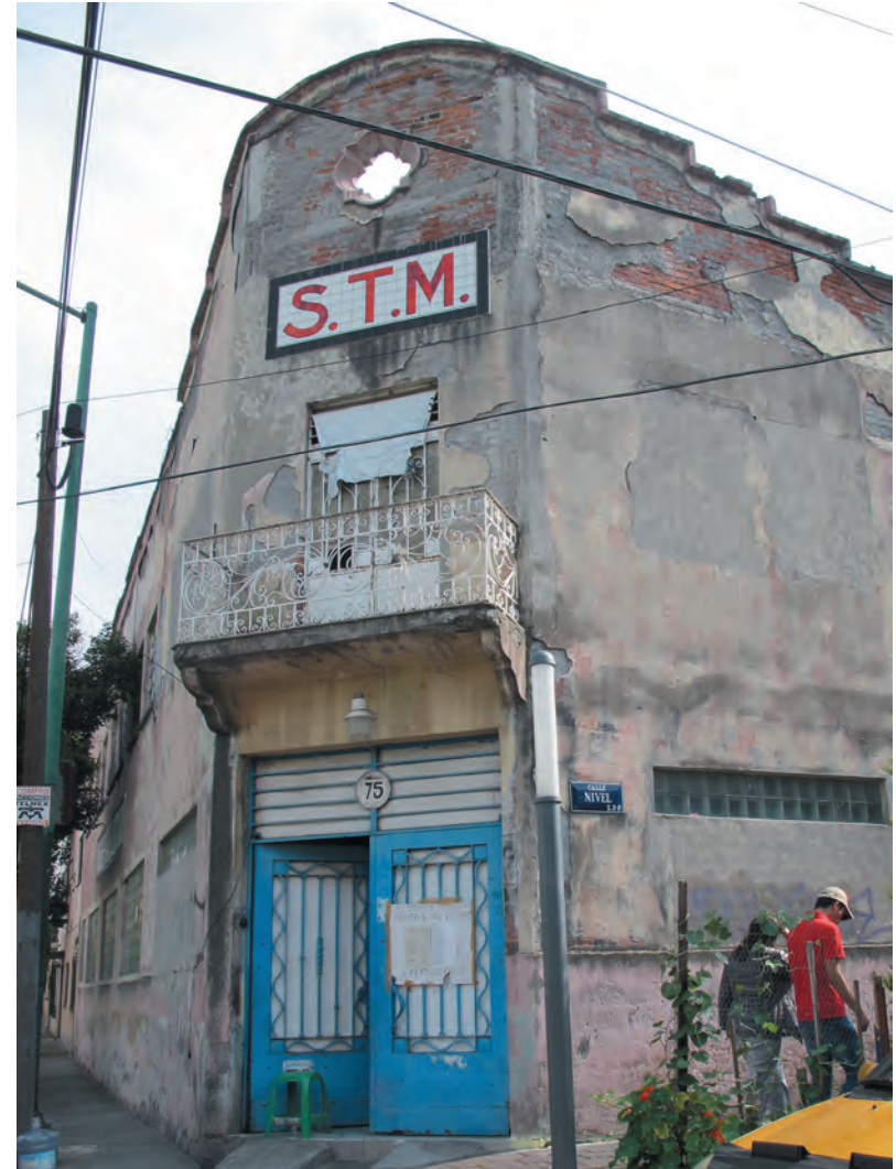
Imágenes 25 y 26. A pesar del particular estilo de las edificaciones de la colonia Merced Balbuena, éstas se han deteriorado paulatinamente.