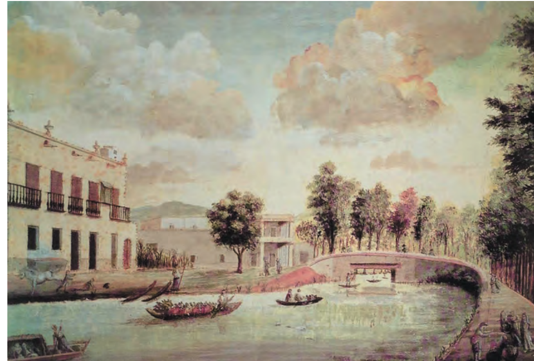
Imagen 6. Vista de los canales de Jamaica retratados por un autor anónimo en 1805.