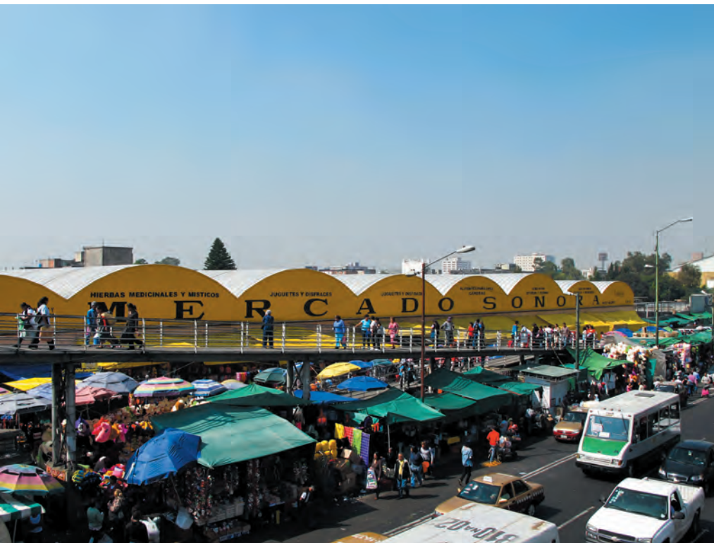
Imagen 29. Vista del Mercado de Sonora ubicado en el perímetro de Merced Balbuena sobre Izazaga, uno de los más intensos y con una gran variedad de productos.