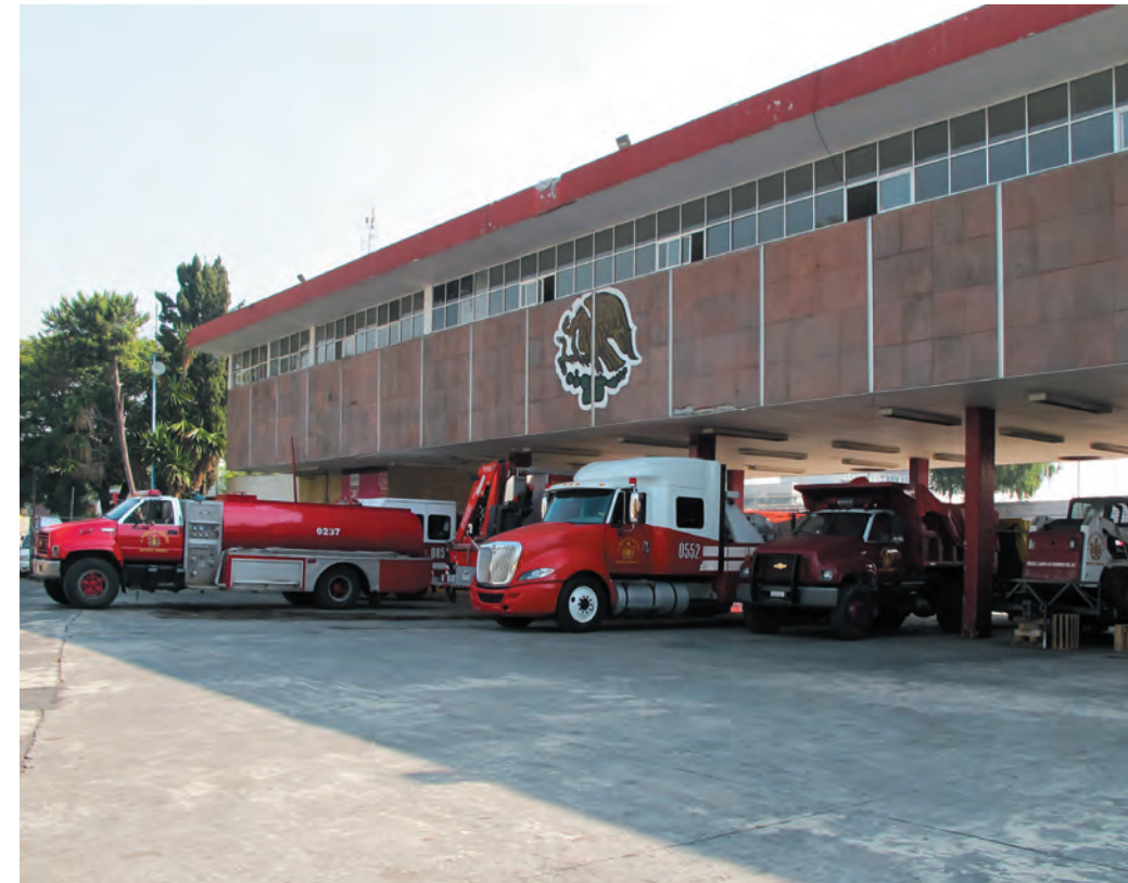
Imagen 30. Vista de uno de los primeros edificios de bomberos en estilo funcionalista ubicado sobre Calzada de la Viga.