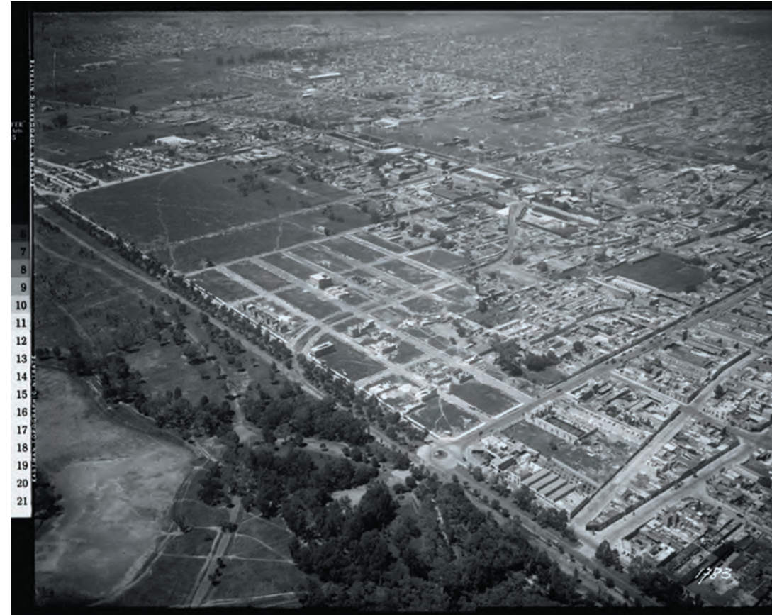
Imagen 15. Vista aérea de la colonia Merced Balbuena, donde corre ondulante el paso del Ferrocarril Industrial, dividiéndola por la mitad. Se puede ver claramente la lotificación de las manzanas y la escasa edificación de casas.