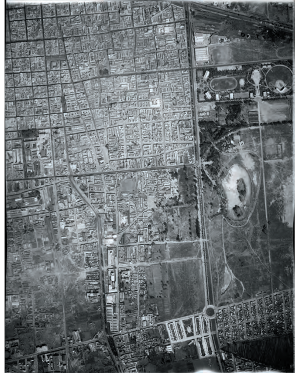
Imagen 5. Vista aérea de 1936, donde todavía no se consolida por completo la colonia Merced Balbuena, pero se distingue claramente por la calle que cruza diagonalmente por donde pasaba el Ferrocarril Industrial. En los alrededores ya se ve la pista elíptica al interior del Deportivo Venustiano Carranza y el Canal de la Viga en su incorporación al centro de la ciudad de México.