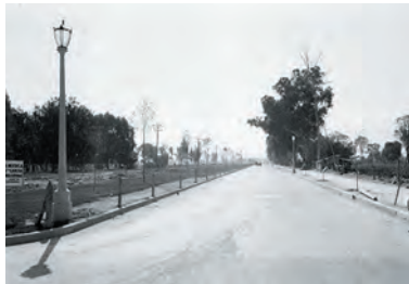
Imágenes 3 y 4. Vistas de la Calzada de Balbuena, la primera tomada en 1920 y la segunda de 1934, donde muestran los avances urbanos de sus calles con alumbrado.

cuando los límites del barrio se han modificado con el tiempo, es posible establecer un perímetro que circunda al Norte, por las calles de Corregidora, Zavala y Candelaria; al Sur, con la avenida Fray Servando Teresa de Mier; en el Oriente, por la avenida Congreso de la Unión y al poniente, con la avenida José María Pino Suárez 9 .