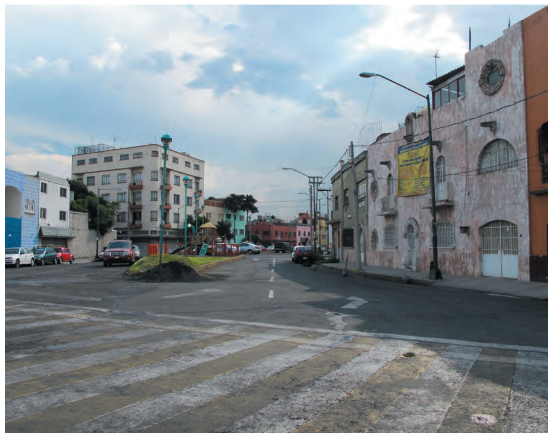
Imagen 34. Vista hacia el Parque Lineal en la calle Oriente 30

La Merced Balbuena se ha ido transformando y ha tratado de adaptarse a la intensidad de uso que alberga y a la erosión que esto genera; condiciones que se han visto reflejadas en el detrimento de la calidad del espacio urbano. Se han transformado espacios que por