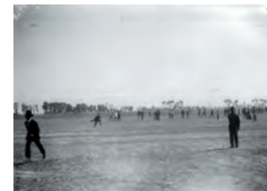
Imagen 7. Personas elegantemente vestidas en los llanos de Balbuena en 1910.