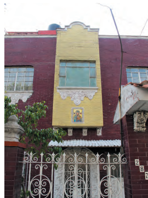
Imágenes 22, 23 y 24. Conjunto de casas neocoloniales en Merced Balbuena, las cuales presentan pequeñas variantes que las distinguen por su color, ventanas, portada, remate del pretil o por tener una pequeña terraza.