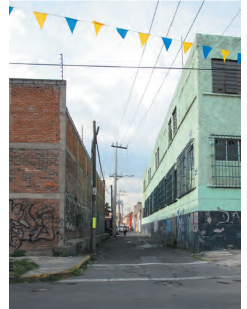
Imágenes 11 y 12 Algunos usos comerciales, de bodegas o industrias generan que sus calles estén o muy concurridas o completamente en abandono.