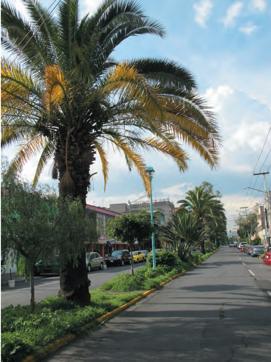
Imagen 16. Calle con camellón al centro.