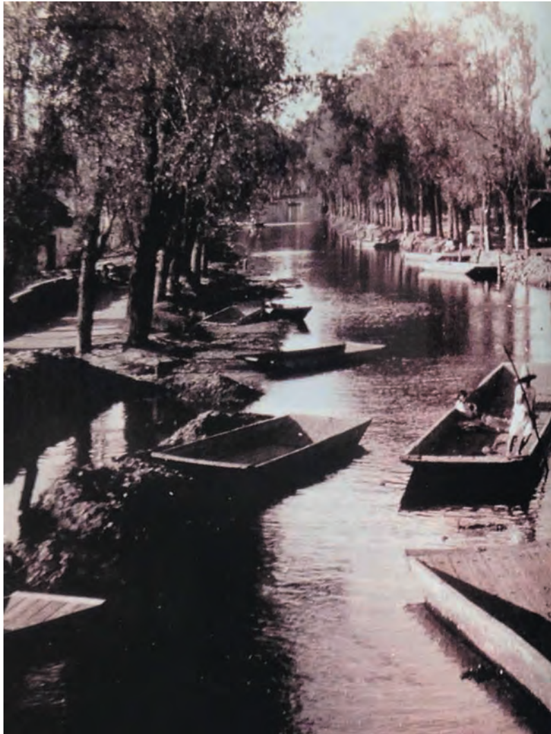
Imagen 10. Vista del fantástico Paseo que significaba transitar por el Canal de la Viga, hoy entubado y convertido en una amplia e intensa vialidad.