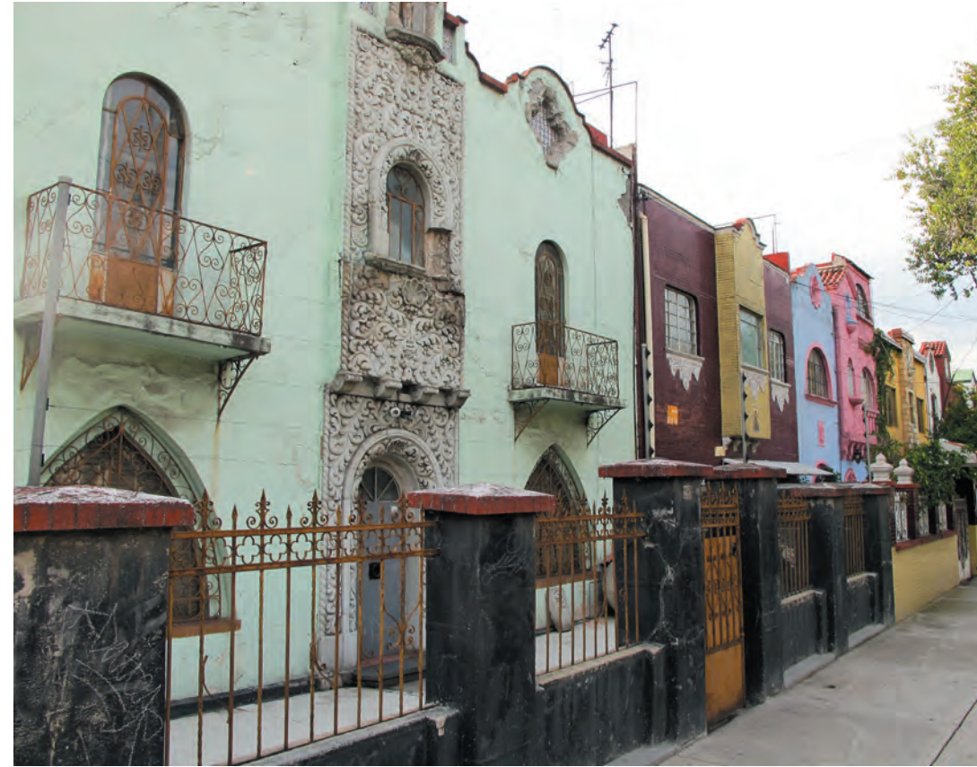
Imágenes 18, 19 y 20. Casas funcionalistas y neocoloniales en Merced Balbuena, las cuales le confieren una identidad y un estilo homogéneo en ciertas calles.