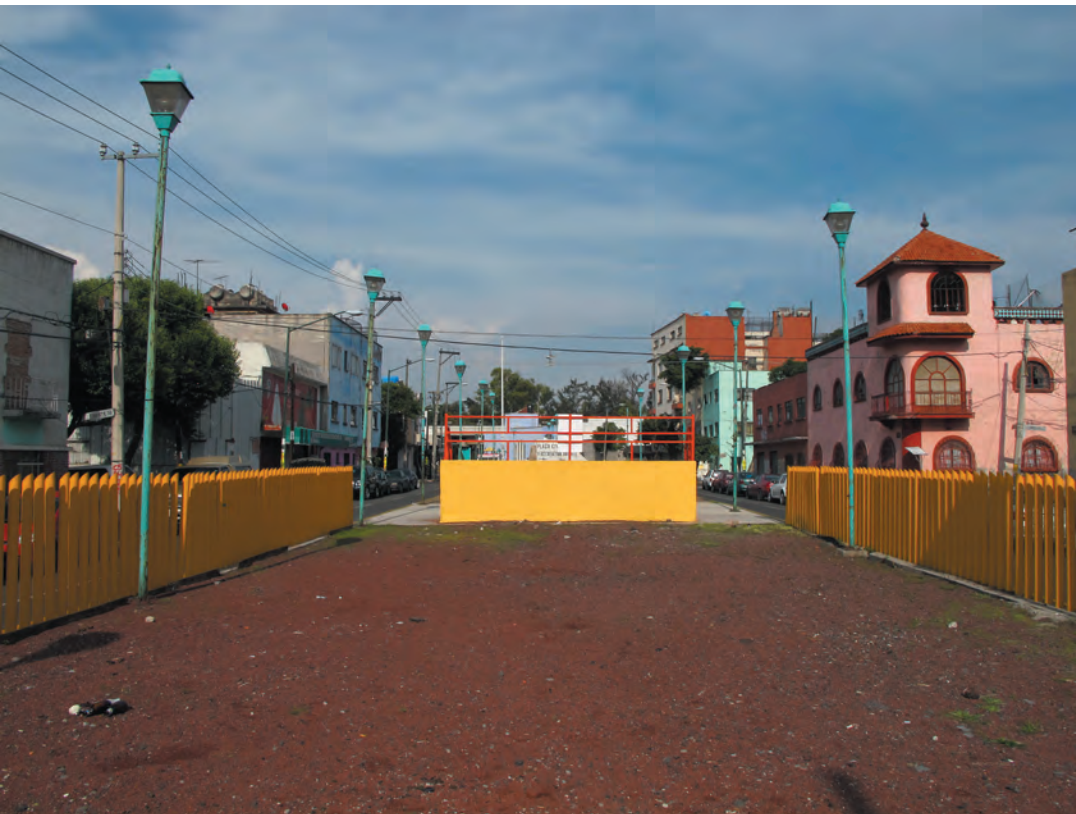
Imagen 35. Vistas hacia el Parque Lineal en la calle Oriente 30 que ocupa el antiguo paso del Ferrocarril Industrial; avenida que ha sido remozada recientemente mejorando el espacio abierto con juegos, canchas deportivas, alumbrado y pavimentos, en un afán por renovar la zona de manera integral.

su configuración formal tenían características valiosas; además, existe una falta de cuidado por parte de los vecinos y de las autoridades. Se han convertido espacios de tránsito, zonas residuales, etcétera; por los que no hay cuidado de la colonia, salvo contados ejemplos, como la reciente intervención al espacio público del Parque Lineal sobre la calle Oriente 30. Estas condiciones van afectando de manera paulatina a las construcciones y a los usos aledaños, en detrimento del Patrimonio.