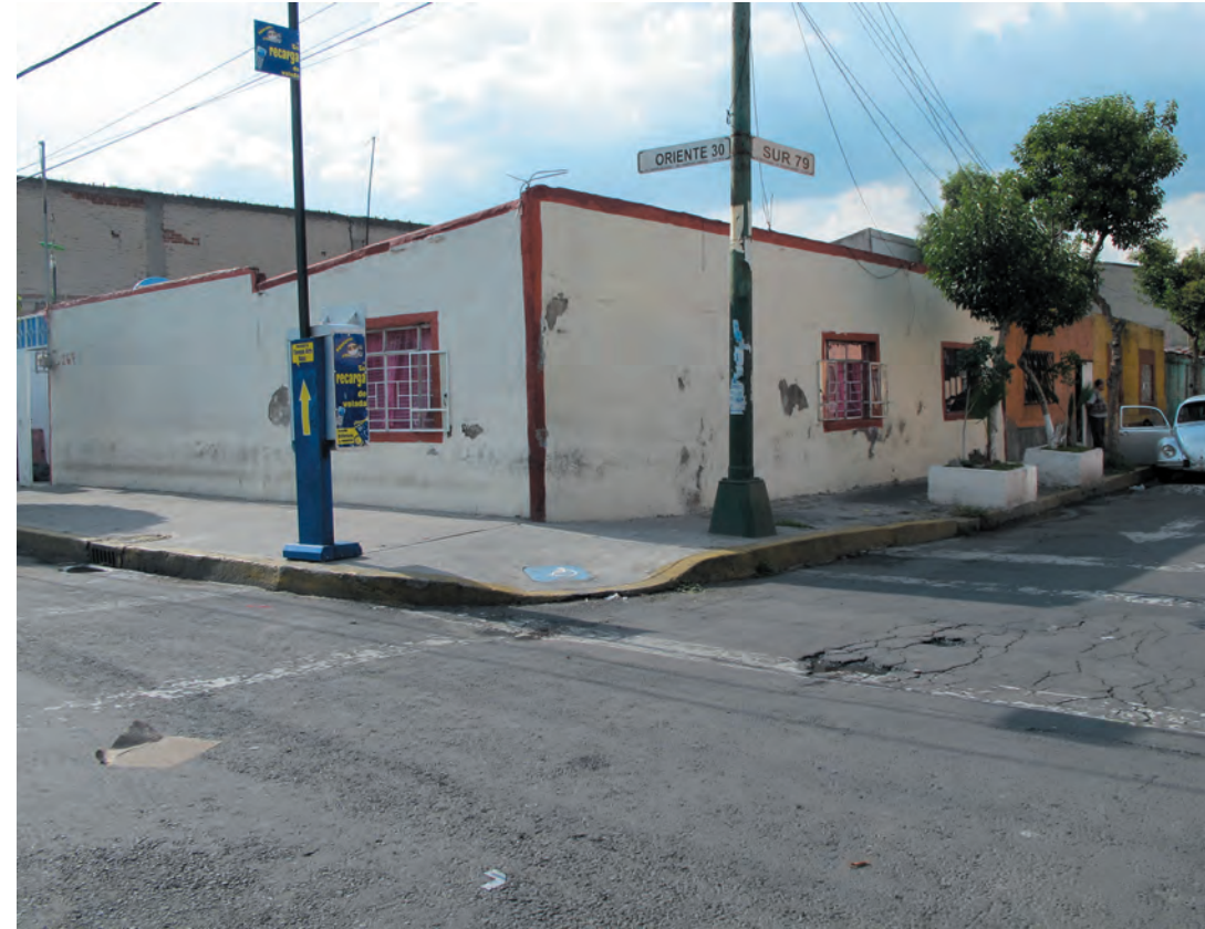
Imagen 17. Casas de un solo nivel de factura muy sencilla, pero armónica en Oriente 30 y Sur 79.