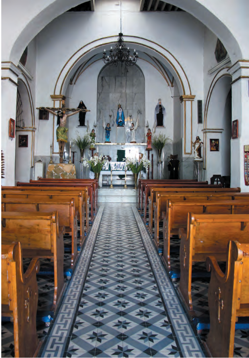
Imágenes 13 y 14. Exterior e interior de la Parroquia de la Concepción Ixnahualtongo.