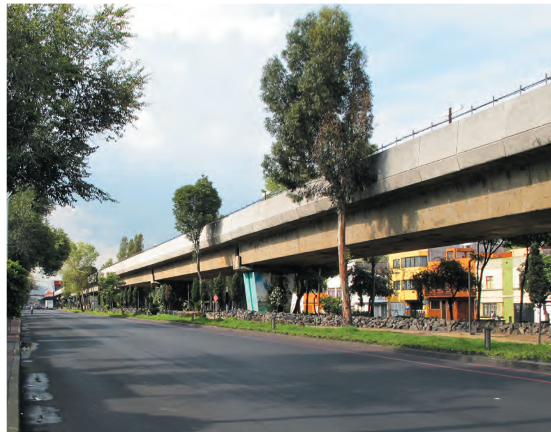
Imagen 9. Congreso de la Unión, límite oriente de la colonia Merced Balbuena, se convirtió en una gran barrera de integración con el resto de los llanos de Balbuena, y visualmente se modificó el paisaje con el Metro Elevado que pasa al centro de la avenida.