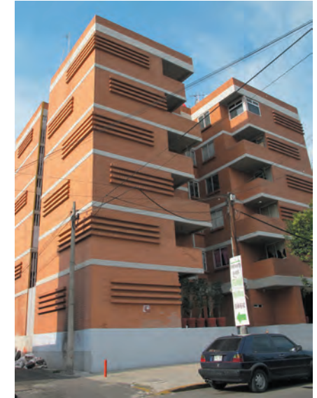
Imágenes 32 y 33. Viviendas de interés social donde, debido al tratamiento de sus plantas bajas con accesos vehiculares o con el cierre de bardas, dificultan la posibilidad de convivencia vecinal.